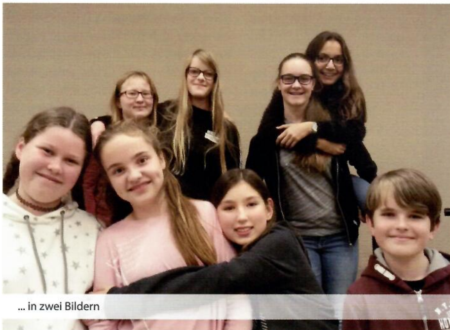
... in zwei Bildern