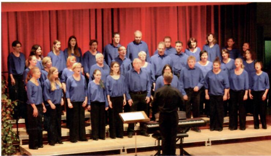
Und als letzter Frohsinnschor die Voices

Die Chorgemeinschaft Dannstadt hatte im Rahmen der Feierlichkeiten zum 1250-jährigen Bestehen der Ortsteile Dannstadt und Schauernheim alle Chöre der Verbandsgemeinde zu einem Liederabend am 16. September eingeladen. Der Frauenchor, der Männerchor und die Voices des MGV Frohsinn Rödersheim nahmen diese Einladung gerne an. Insgesamt traten an dem Abend zehn Chöre auf. Schön mal alle beisammen zu haben!