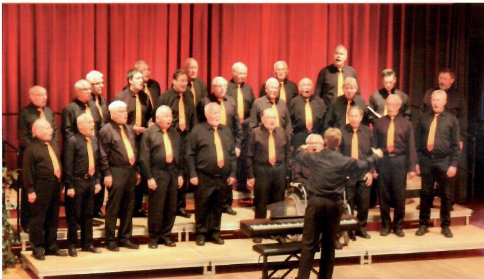
Danach die Buben vom Männerchor