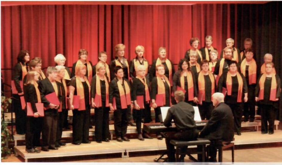
Frauenchor beim ersten Gastchorauftritt