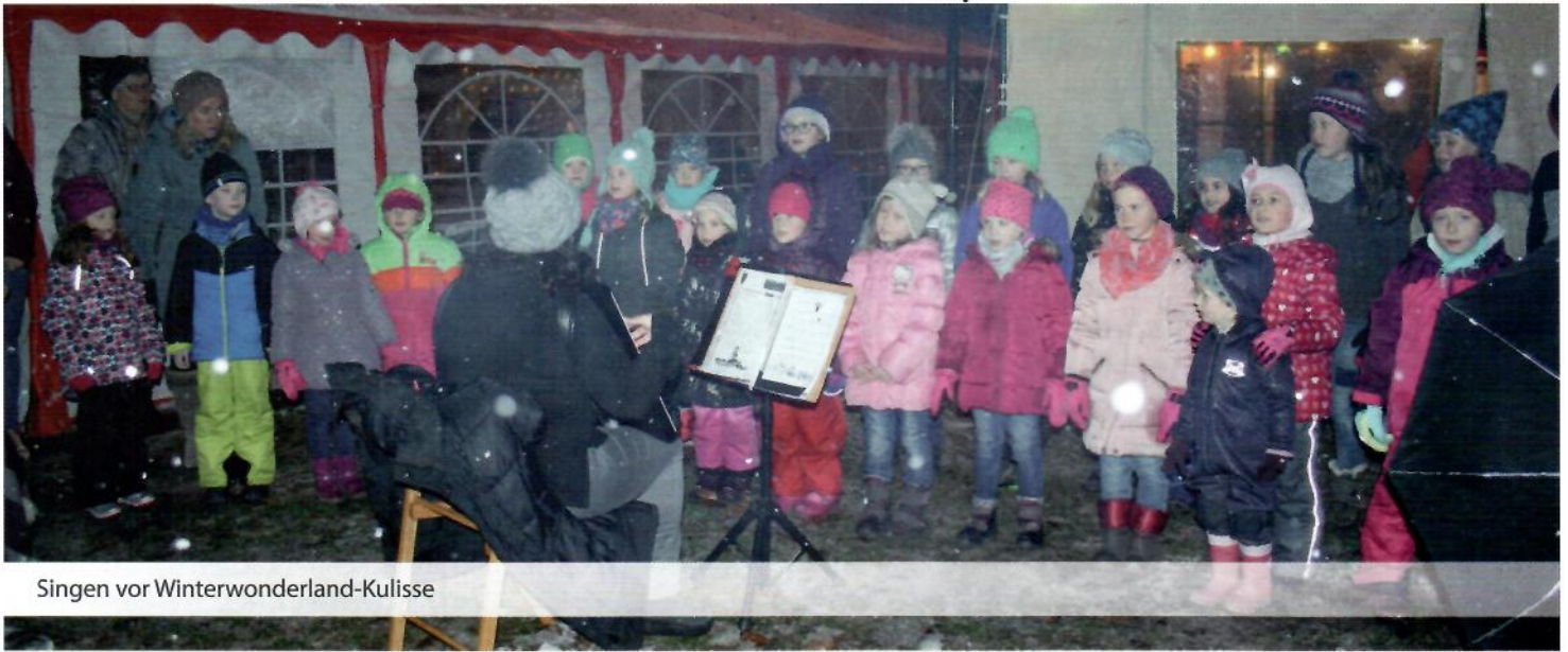
Singen vor Winterwonderland-Kulisse