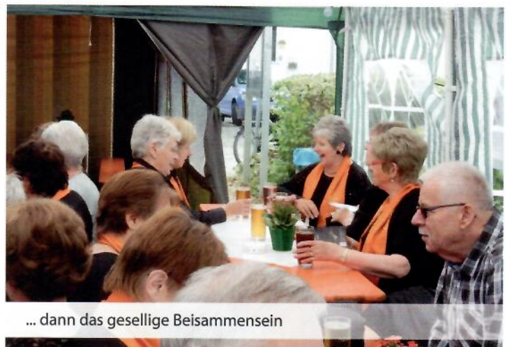
... dann das gesellige Beisammensein