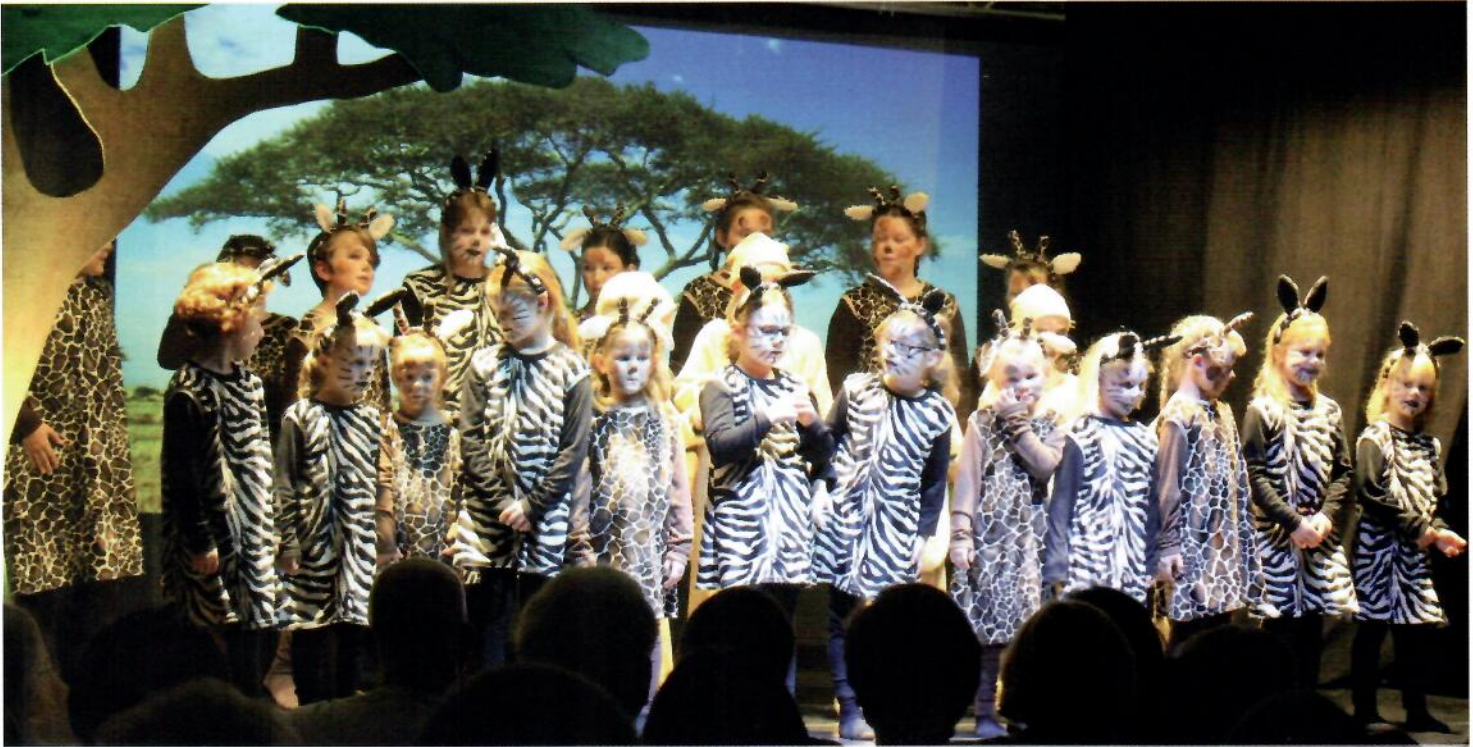
Giraffen und Zebras - letztendlich in Freundschaft vereint