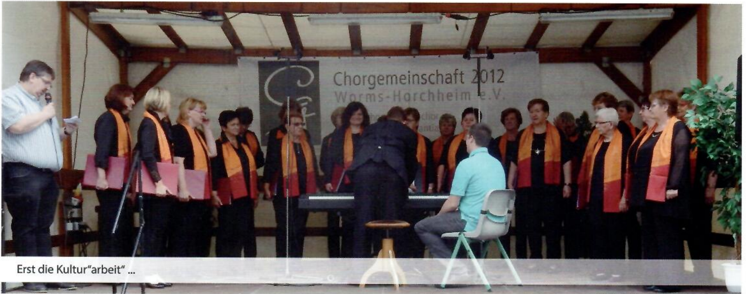
Erst die Kultur"arbeit" ...

Die Chorgemeinschaft 2012 Worms-Horchheim lud den Frauenchor des MGV Frohsinn Rödersheim zu ihrem Jubiläum „25 Jahre Frauenchor“ ein. Gefeiert wurde das Jubiläum mit einem Chor-Open-Air beim Horchheimer Marktbrunnenfest am 1. und 2. Juli 2017.