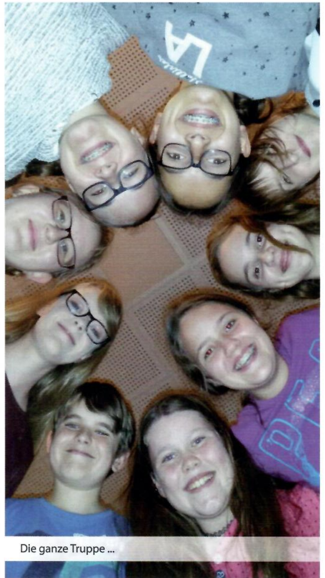
Die ganze Truppe ...