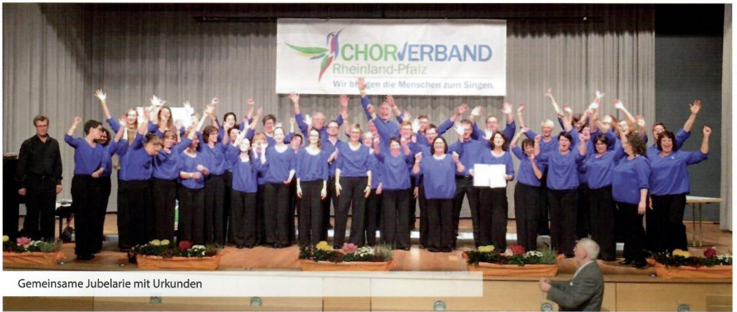
Gemeinsame Jubelarie mit Urkunden

mit unseren mitgereisten Fans und den anderen Chören überbrückt. Ziel war es, bei mindestens zwei Liedern mit sehr gut und den anderen zwei mit der Note gut bewertet zu werden. Endlich die Ergebnisse. 14 der 15 angetretenen Chöre haben die Kriterien erfüllt und dürfen sich „Meisterchor des Chorverbandes Rheinland-Pfalz“ nennen. Die Voices wurden bei allen vier Liedern mit sehr gut bewertet und erhielten dabei für den Vortrag „Als wir jüngst in Regensburg waren“ mit 24,33 von 25 möglichen Punkten die Tageshöchstwertung aller 60 vorgetragener Lieder. Angenommen von den Vorträgen der Voices, lobte der Präsident des Chorverbandes einen Preis für ein „ausgewogenes Programm mit spannender Präsentation und besonderer chorischer Ausstrahlung“ aus, den er uns überreichte.