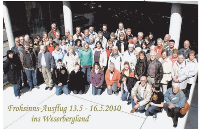
Frohsinns-Ausflug 13.5 - 16.5.2010 ins Weserbergland