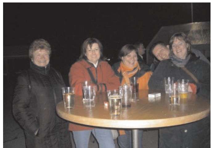
Die Frohsinns-Damen feiern