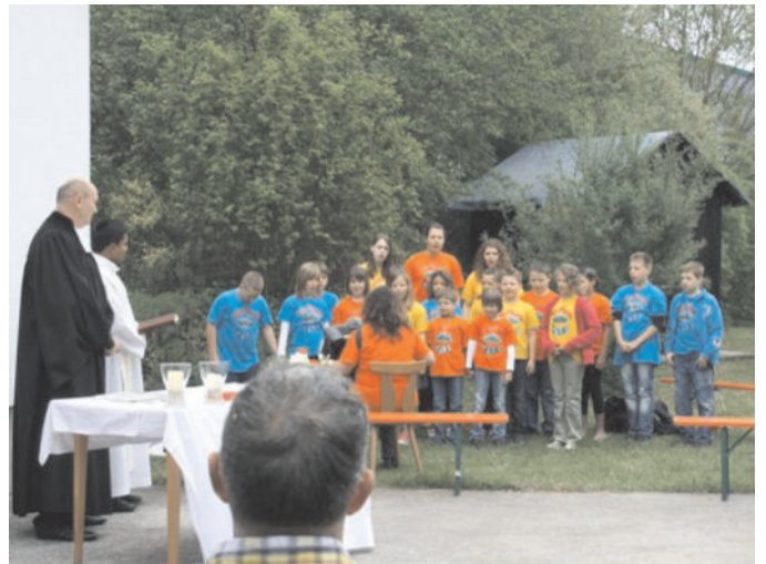
Die Swinging Kids beim TCR

Anschließend wurde bei reichlich Essen und Trinken gefeiert. Trotz des bescheidenen Wetters, waren alle guter Laune. Mit den „Schobbehauer“ fand das gemütliche Fest einen schönen Ausklang.