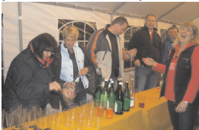
Der Frohsinn beim Ausschank