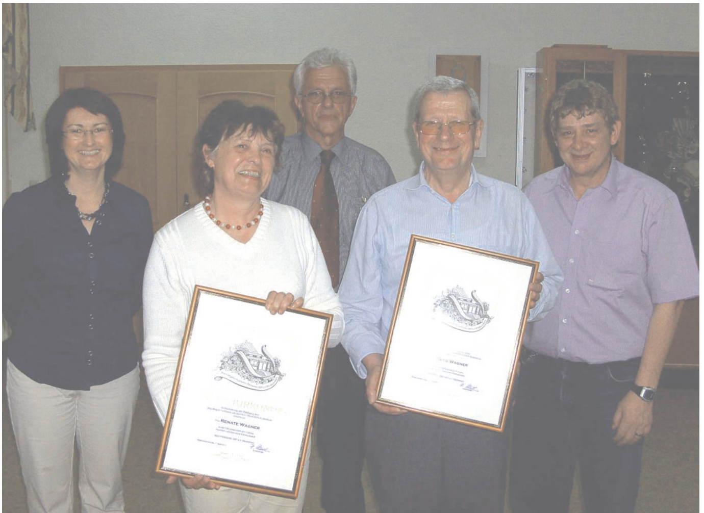
Ehrung verdienter Mitglieder bei der Generalversammlung des MGV Frohsinn Rödersheim e.V.

Besuchen Sie das SOMMERFEST BEIM FROHSINN 18. und 19. Juni 2011